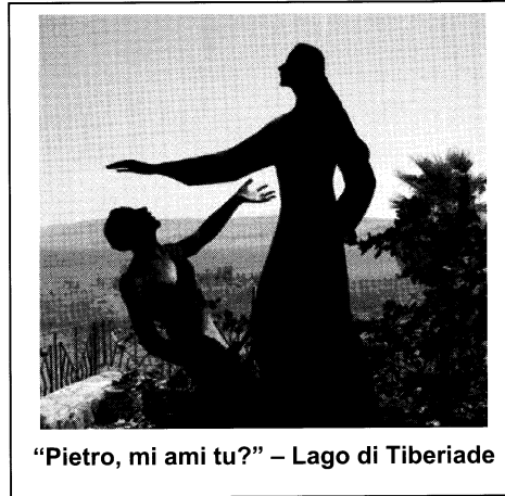
“Pietro, mi ami tu?” – Lago di Tiberiade

E' evidente nell'atteggiamento del giovane ricco (Mc 10,17) che corre e si inginocchia, per l'epoca atteggiamenti sconvenienti. In Marco corre solo l'indemoniato che è prigioniero della sua violenza. e si inginocchia solo il lebbroso, che è considerato un peccatore punito. Quindi la pratica religiosa e la